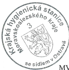
MVDr. Michaela Pavelková vedoucí oddělení hygieny dětí a mladistvých Krajské hygienické stanice Moravskoslezského kraje se sídlem v Ostravě

Předložené podklady/návrh odpovídají požadavkům zákona č. 258/2000 Sb., o ochraně veřejného zdraví a o změně některých souvisejících zákonů, ve znění pozdějších předpisů, vyhlášce č. 410/2005 Sb., o hygienických požadavcích na prostory a provoz zařízení a provozoven pro výchovu a vzdělávání dětí a mladistvých, ve znění pozdějších předpisů a souvisejících předpisů.